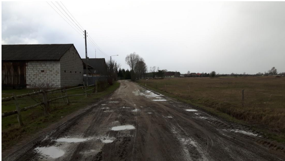
stan obecny planowanej do przebudowy drogi gminnej

Droga usytuowana na wyżej wymienionych działkach ewidencyjnych łączy osiedle domów z drogą powiatową nr 1436D. Droga prowadzi również do gospodarstwa agroturystycznego „Nad Jaźwinkiem”.