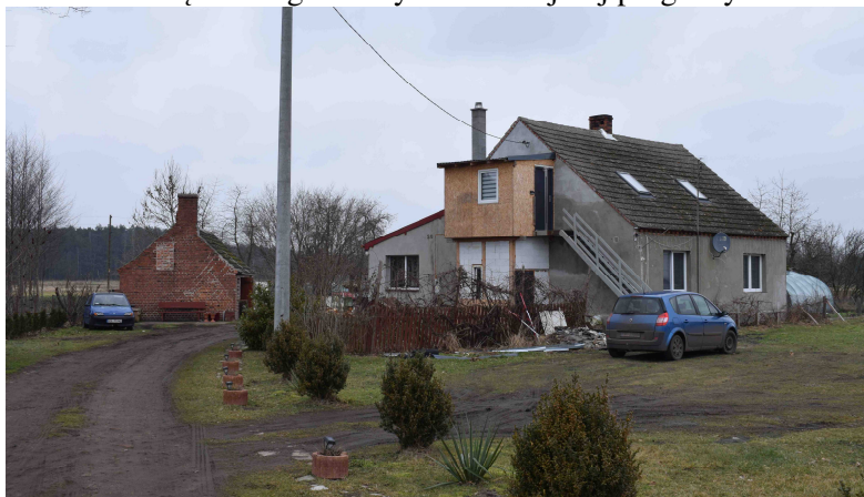
Widok na zabudowania na sąsiedniej działce nr 30/1. Na pierwszym planie budynek mieszkalny i gospodarczy, w głębi widoczne zadrzewienia sadu usytuowanego na przyległej działce nr 30/3 objętej planem miejscowym.

usługowej oraz tereny rolnicze. Działka objęta opracowaniem posiada powierzchnię 0,49 ha. Granice terenu objętego planem są określone na załączniku graficznym do niniejszej prognozy.