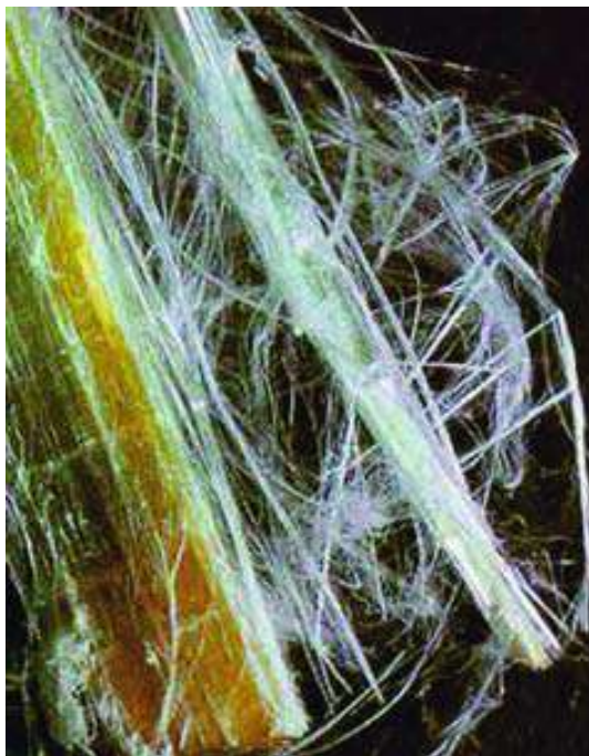
Fot. 1 Struktura włókien azbestowych

Przyjmuje się, że azbestami są włókniste odmiany minerałów występujące w przyrodzie w postaci wiązek włókien cechujących się dużą wytrzymałością na rozciąganie, elastycznością i odpornością na działanie czynników chemicznych i fizycznych. W przyrodzie występuje około 150 minerałów w postaci włóknistej, które w czasie procesu produkcyjnego mogą się rozdzielać na sprężyste włókna czyli fibryle.