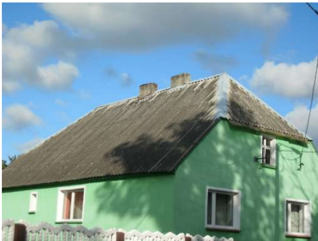
Fot. 11. Azbest na budynku mieszkalnym. W miejscowości Czeszyce