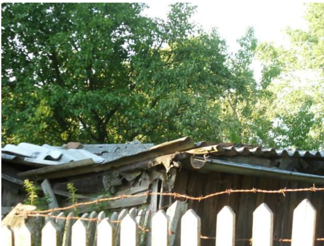
Fot. 4. Połamane i zluzowane płyty azbestowe o pilniejszym stopniu usunięcia we wsi Brzostówko.