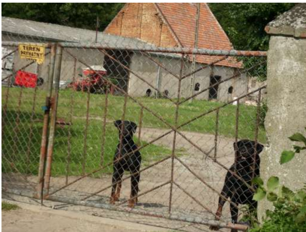
Fot. 9. Budynek pokryty azbestem, na terenie szczególnie strzeżonym przed osobami postronnymi, w Brzostowie.

W sytuacji występowania niektórych z przywołanych przesłanek część wyliczeń ma charakter szacunkowy, a ze względu na wszystkie obszary problematyczne w tabelach inwentaryzacyjnych odznaczono wątpliwe przypadki wymagające ewentualnego skonfrontowania z właścicielem lub bardziej wiarygodnymi, aktualnymi podkładami geodezyjnymi – o ile takie się pojawiają.