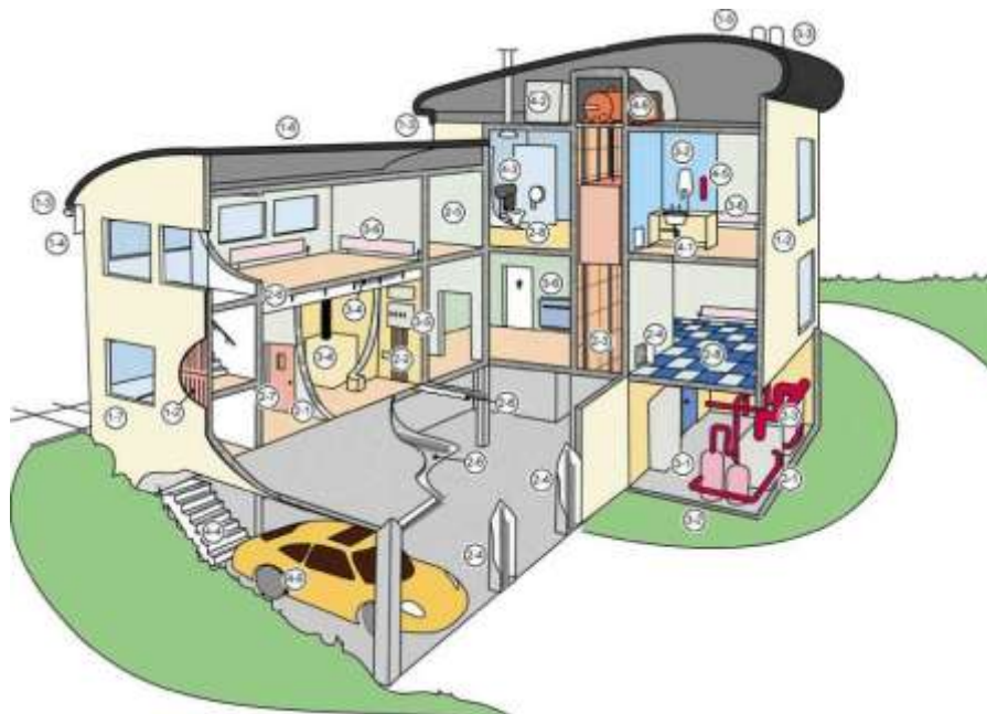
Rysunek nr 1 - Schemat przedstawiający typowe lokalizacje materiałów zawierających azbest w budynkach, instalacjach, urządzeniach