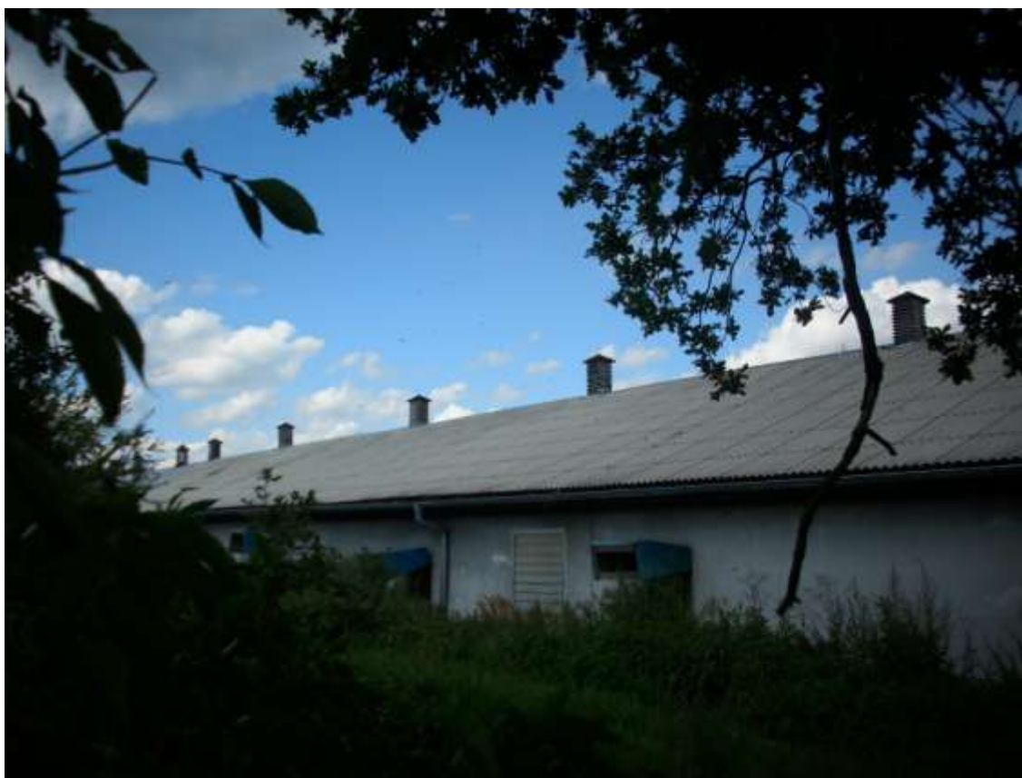
Fot. 7. Dachy azbestowe na obiektach fermy we wsi Łazy Wielkie

Listę inwentaryzacyjną, z podziałem na poszczególne miejscowości, rozszerzone o lokalizacje obiektów i ogólne uwagi - przedstawiono w Załącznikach nr 6 – 21 do Programu. Na listach tych ze względu na brak, na dostępnych mapach, niektórych zabudowań wskazane pozycje (odznaczone przez podkreślenie) należy sukcesywnie