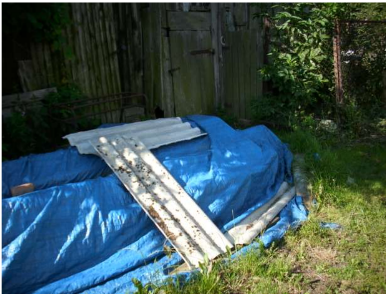
Fot. 2. Zdjęte płyty azbestowe we wsi Czernogoździce (odpad niebezpieczny).

Odpady powyższe przez swoją specyfikę oraz fakt, iż azbest został zaliczony do substancji stwarzających szczególne zagrożenie dla środowiska ( ustawa Prawo ochrony środowiska; art.160 ust.2 ) podlegają bardzo rygorystycznym i szczegółowym zasadom postępowania z nimi na każdym etapie gospodarowania od momentu wytworzenia (demontażu), poprzez magazynowanie i transport, do ostatecznego unieszkodliwienia (utyliczacji).