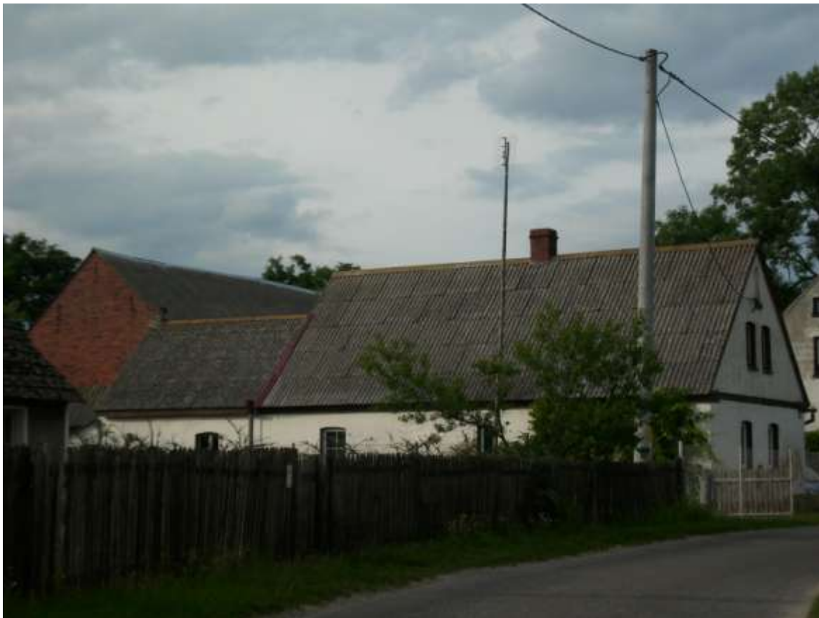
Fot. 5. Wykonane z płyt azbestowych pokrycie dachu w budynku mieszkalnym i na budynkach gospodarskich we wsi Kuźnica Czeszycka

Oprócz odnotowania informacji kierunkowej o sposobie przeznaczenia obiektów, na których azbest występuje z ogólnym podziałem na: