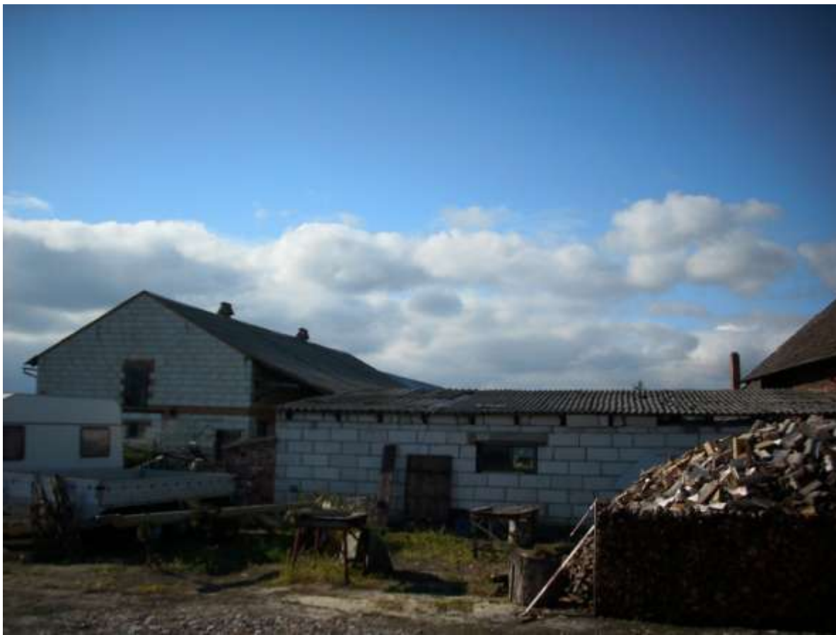
Fot. 6. Dachy azbestowe o różnych spadkach. Budynki gospodarcze we wsi Kotlarka o pochyleniu dachu 45°, 15°.

Uwzględnienie spadku dachu jest niezwykle istotne w kontekście braku możliwości ich rzeczywistego, fizycznego pomiaru bez użycia np. podnośników.