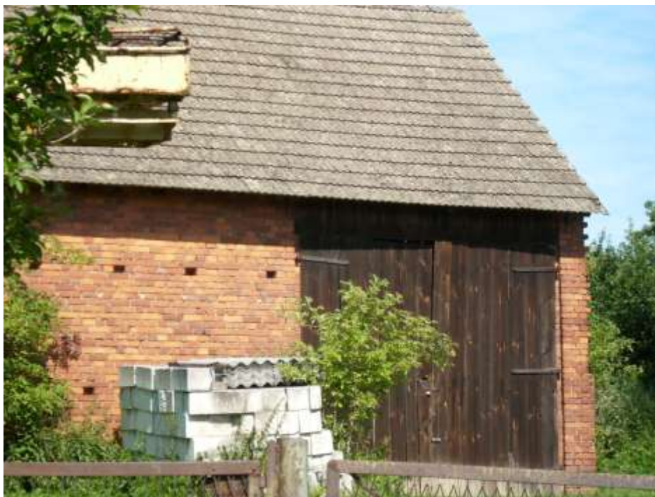
Fot. 10. Stos zdjętych płyt azbestowych (wieś Wierzchowice).

Uwaga: Wówczas cała mieszanka gruzu z azbestem staje się odpadem niebezpiecznym (!)