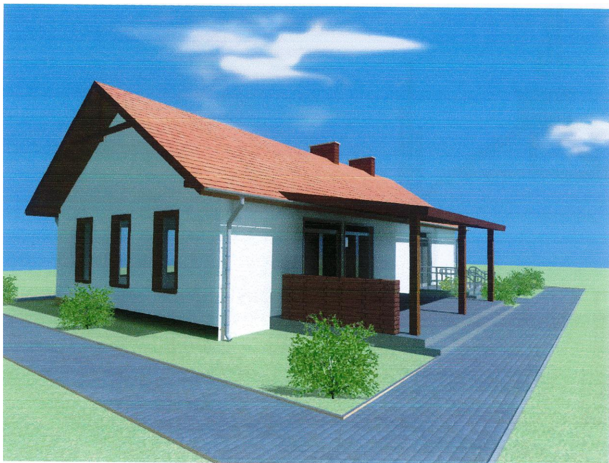
wizualizacja budynku świetlicy w Kuźnicy Czeszyckiej