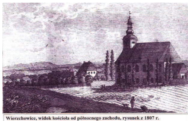
Wierzchowice, widok kościoła od północnego zachodu, rysunek z 1807 r.

Najbardziej imponującą budowlą Wierzchowic jest kościół poewangelicki majestatycznie stojący na wzgórzu. Kroniki tutejszej parafii dokładnie opisują historie jego powstania. Świątynia została uroczystie poświęcona 21 listopada 1773r.