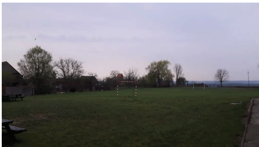
- boisko do piłki nożnej;