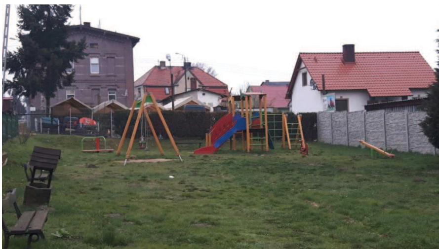
- plac zabaw;