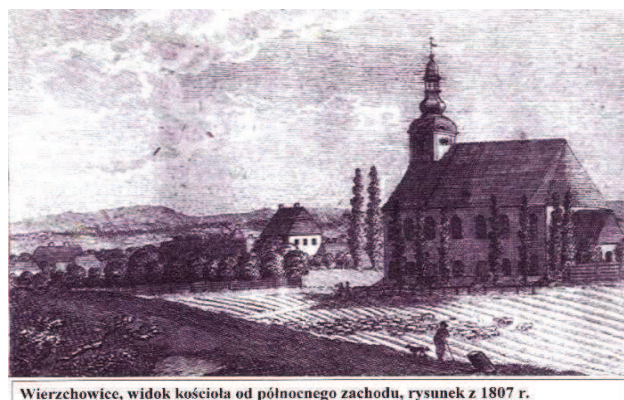
Wierzchowice, widok kościoła od północnego zachodu, rysunek z 1807 r.

Najbardziej imponującą budowlą Wierzchowic jest kościół poewangelicki majestatycznie stojący na wzgórzu. Kroniki tutejszej parafii dokładnie opisują historie jego powstania. Świątynia została uroczystie poświęcona 21 listopada 1773r.