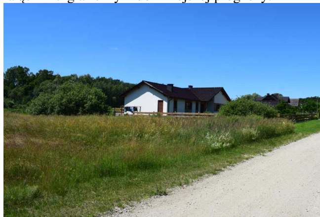
Widok z drogi gminnej na frontową część działki nr 145/3 (po lewej stronie). Dalej za działką widoczna nowa zabudowa mieszkaniowa w Dąbrowie.