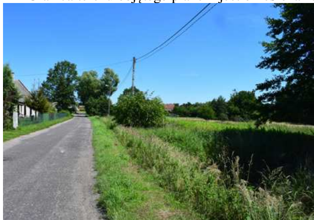
Wjazd do wsi Dąbrowa od strony miejscowości Krośnice. Po prawej stronie widoczna działka nr 157, stanowiąca teren rolniczy.

Granica terenu objętego planem jest określona na załączniku graficznym do niniejszej prognozy.