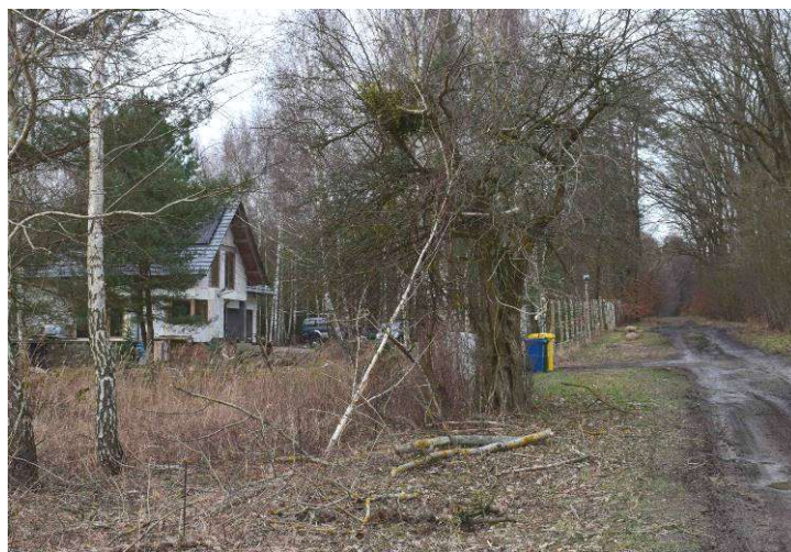
Nowo powstająca zabudowa mieszkaniowa na działkach usytuowanych wzdłuż drogi gminnej (działka nr 214). Działki usytuowane są w sąsiedztwie enklaw leśnych, w szczególności sosnowych z domieszką brzozy.