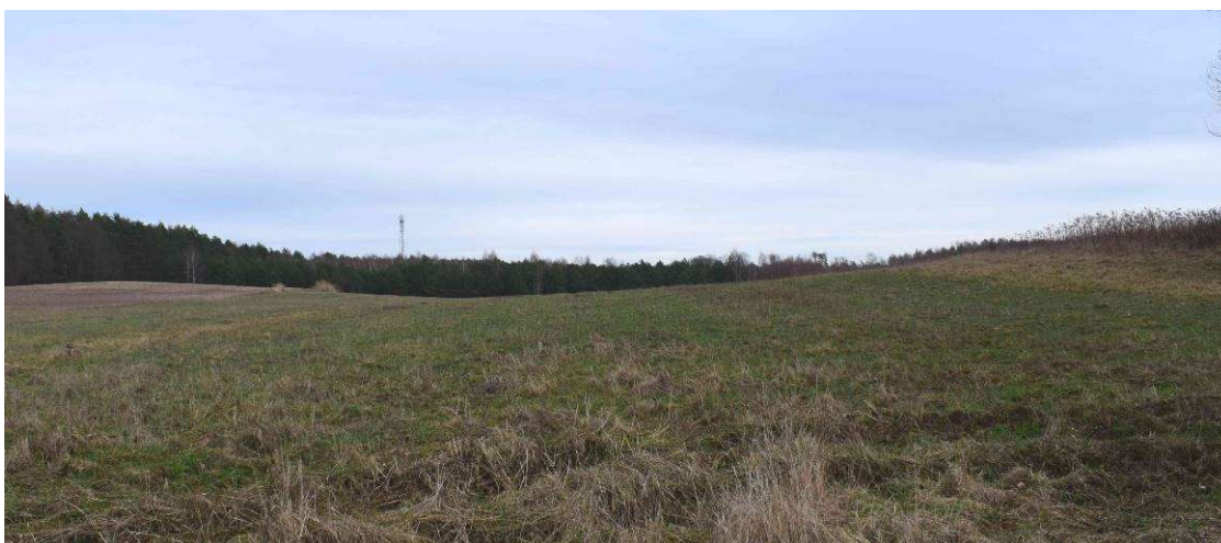
Działka nr 32 w Łazach Wielkich widoczna z drogi gminnej (działka nr 214). Działka wykorzystywana jest rolniczo i pozbawiona zadrzewień i zakrzewień. W głębi lasy otaczające miejscowość.

łańcuchowym, powstała wzdłuż dróg powiatowych nr 1450D i 1453D oraz ich odnóg - dróg gminnych. We wsi dominuje zabudowa zagrodowa oraz mieszkaniowa jednorodzinna. Gospodarstwa rolne są raczej niewielkie, a hodowla zwierząt ma charakter marginalny. Część mieszkańców zajmuje się rolnictwem, natomiast pozostała część dojeżdża do pracy w większych miejscowościach. Ze względu na niewątpliwe walory krajobrazowe we wsi rozwija się zabudowa związana z rekreacją indywidualną i turystyką. Jest ona lokalizowana w szczególności wzdłuż dróg gminnych stanowiących odnogi dróg powiatowych. Są to tereny rolnicze z dużą ilością niewielkich enklaw leśnych. Tak jest w przypadku działki nr 32, która jest niezabudowana i wykorzystywana rolniczo. Od strony zachodniej działka przylega do drogi gminnej (dz. nr 214) przy której znajdują się wyznaczone w obowiązującym planie miejscowym tereny zabudowy pensjonatowej MP i letniskowej ML. Na tych terenach rozwija się mieszana zabudowa: mieszkaniowa jednorodzinna, letniskowa i turystyczna.